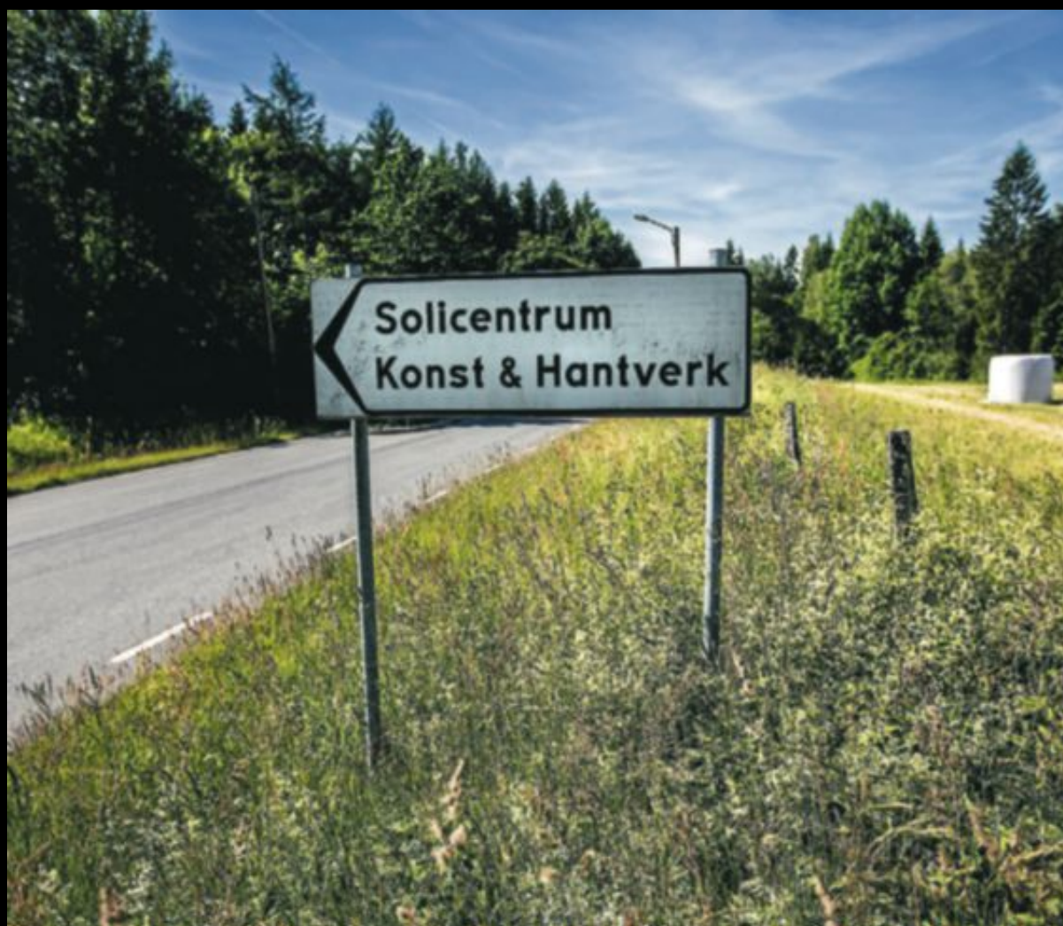
Vid skolan i Killeberg finns en av Linbusamfundets fastigheter. På skylten som leder till gården står det Sollicentrum. Samma namn använder Linbu när samfundets studenter är ute och säljer smycken på mässor och i mataffärer.