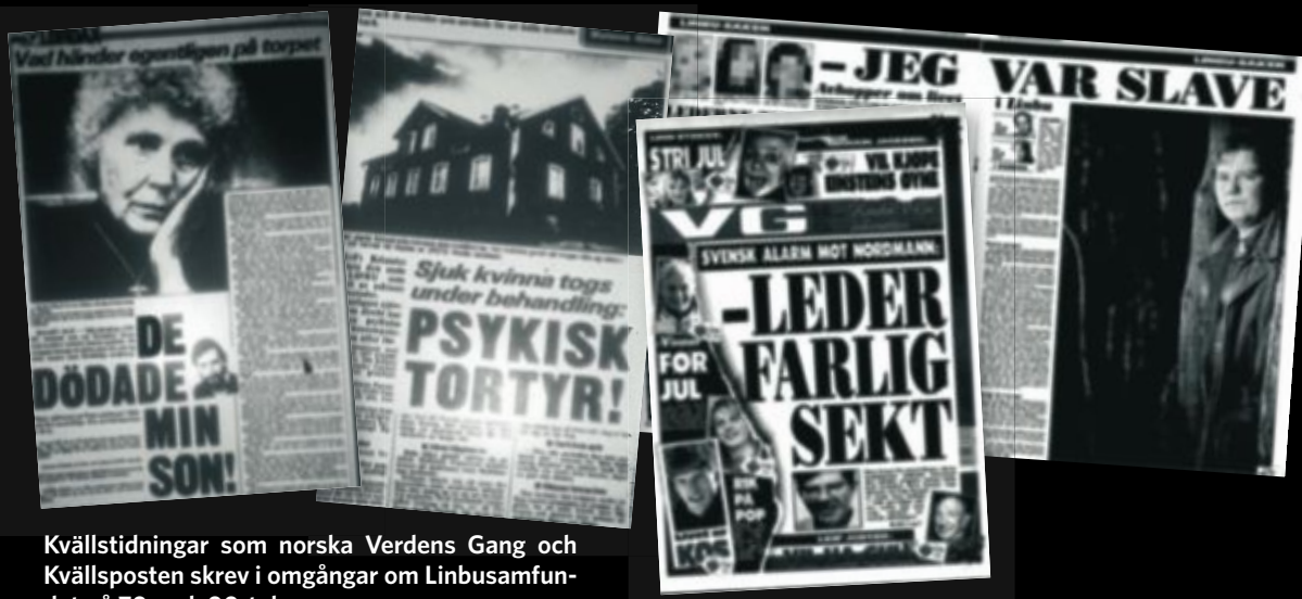
Kvällstidningar som norska Verdens Gang och Kvällsposten skrev i omgångar om Linbusamfundet på 70- och 90-talen.