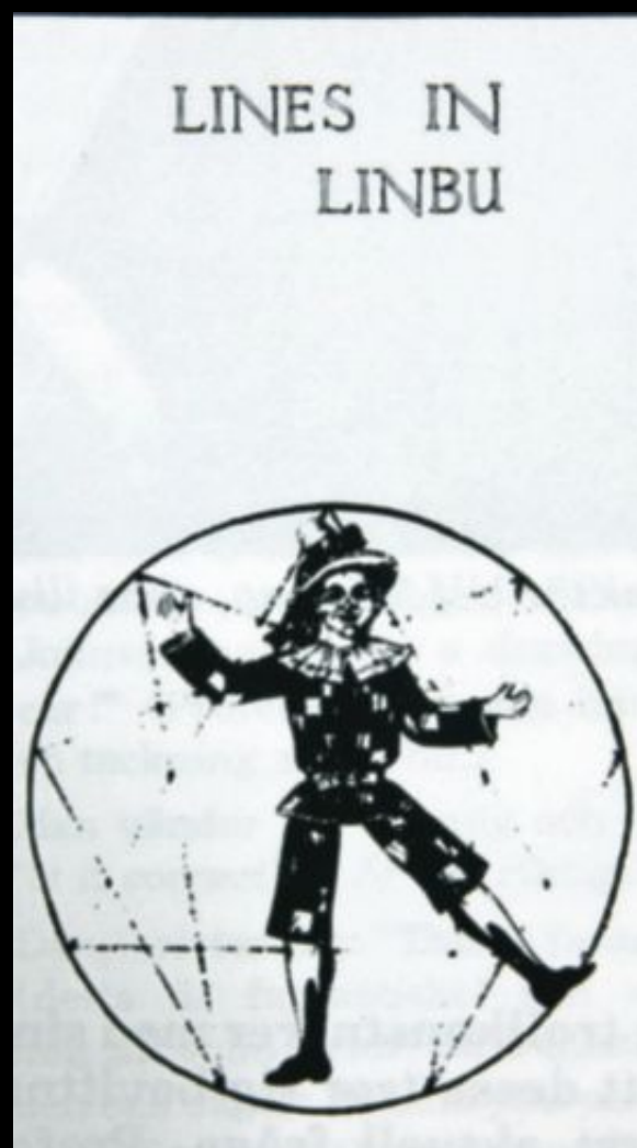
Förstasidan på en tidskrift som Joula - Glädjens och solens samfund (Linbusamfundets föregångare) gav ut på 70-talet.